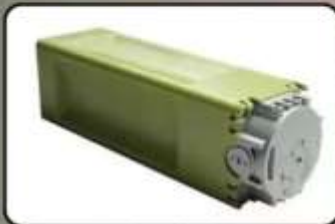
Протитранспортна міна ПТМ-3