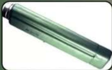
Протитранспортна міна ПТМ-1