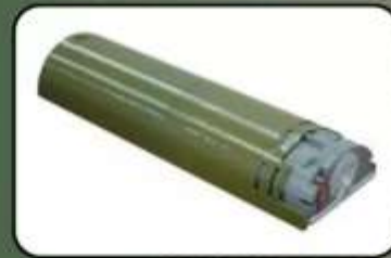
Протитранспортна міна ПТМ-4

Міна може бути пофарбована в зелений, сіро-зелений, жовто-сірий або коричнево-сірий колір.