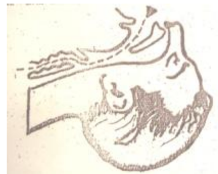
Рисунок 4 Техніка проведення штучного дихання – відновлення прохідності дихальних шляхів – корінь язика відійшов від входу в гортань