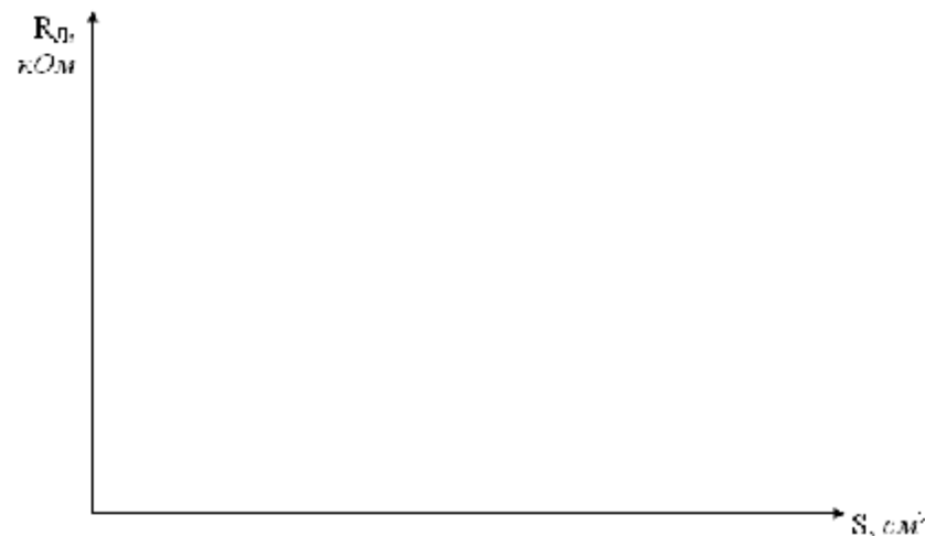
Рисунок 2 Графік залежності опору тіла людини від прощі контакту