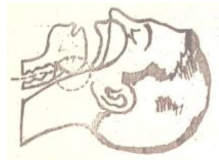
Рисунок 3 Техніка проведення штучного дихання – порушений стан прохідності дихальних шляхів (вхід у гортань прикритий язиком і підгортанником)