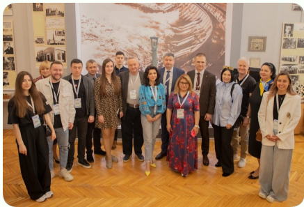
Уже скоро розпочинається вступна

кампанія-2024, і Запорізька політехніка робить усе можливе, щоб допомогти абітурієнтам з вибором майбутньої професії. Учасники традиційного весняного Career Forum поспілкувалися з представниками факультетів і студентського самоврядування, а також отримали розгорнуту консультацію з правил прийому від експертів Запорізької політехніки зі вступу. Наших гостей натхненно привітали ректор НУ «Запорізька політехніка» Віктор Грешта, керівники органів місцевого самоврядування, очільники сучасних